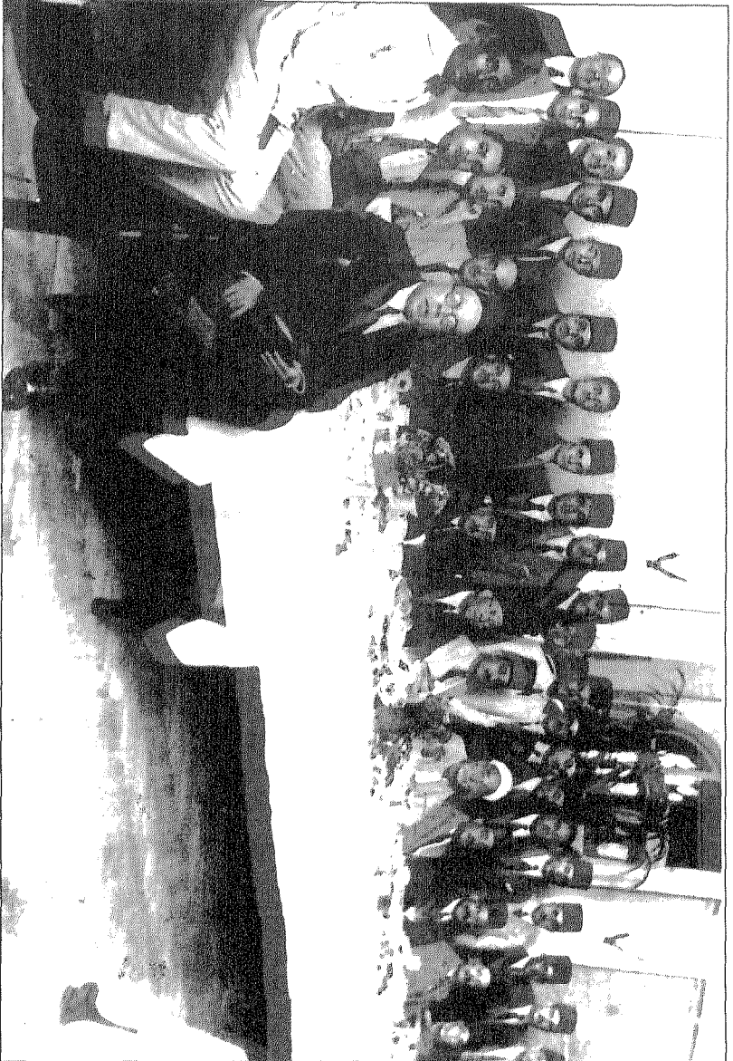
حفل شاي في دار الجهاد يقسم كبار الشخصيات السياسية والأدبية، وعلى رأسهم: مصطفى النحاس ومبايخ المقاد والشيخ المرافي ومجموعة من أعضاء الوفد ومهم توفيق دياب.